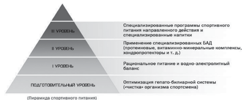
Рис. 1. Уровни организации и структура эргогенного спортивного питания — пирамида спортивного питания

Пирамида спортивного питания — это многоуровневая система организации, структуры и свойств всех компонентов эргогенного спортивного питания, направленная на достижение максимального эффекта (рис. 1).