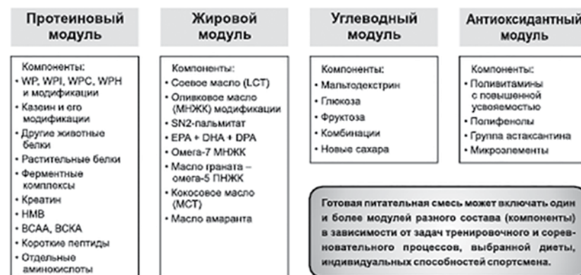
Рис. 4. Модульный принцип построения индивидуальных дополнительных питательных смесей для спортивного питания

На практике спортивные смеси (СППС) строятся по модульному типу (протеиновый, жировой, углеводный и др.), что позволяет гибко менять состав в соответствии с задачами НМП (нутритивно-метаболической поддержки). Компоненты каждого из модуля приведены на рис. 4 .