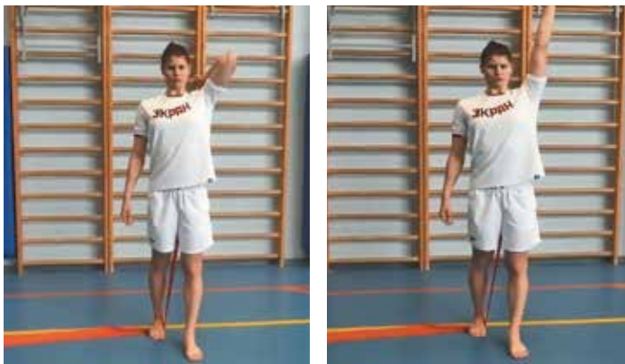
5. Жим над головой с разгибанием руки (фото 5)