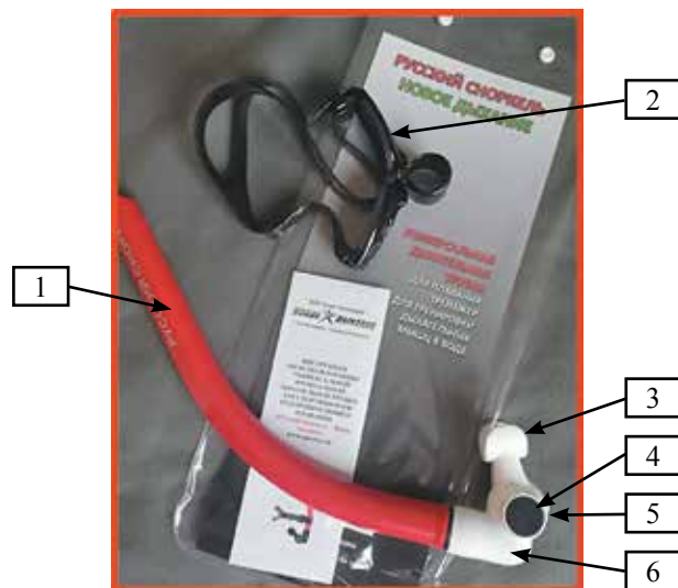
Рисунок 4. Комплектация универсальной дыхательной трубы (УДТП) «Русский snorkель – Новое дыхание»

Универсальная ДТ для плавания (УДТП) «Русский snorkель – Новое дыхание» состоит из собственно дыхательной трубы (1), налобника (2), загубника (3), клапана выдоха (4), ручки регулятора нагрузки на выдохе (5), корпуса нагрузочного узла (6) (рис. 4).