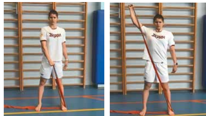
3. Подъем руки по диагонали вверх (левая, правая) (фото 3)

После выполнения силового упражнения без отдыха проплыть в координации задание «на гребки» в объеме 2–3 мин (3 x 50 м P23–24, инт. 15–20 с., 25 м.!!! + 25 м. «закупка» – на пульсе 23–24 уд./10 с.). Общее время тренировочного задания 2–3 мин. Отдых 1 мин.