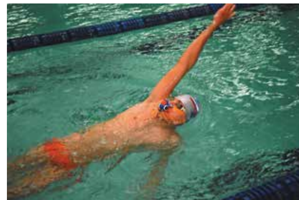
Рисунок 6б. Плавание на спине с ТДМД «Русский флаттер – Новое дыхание»

Примерные тренировочные программы по использованию ТДМД «Русский флаттер – Новое дыхание» в подготовке пловцов-спинистов.