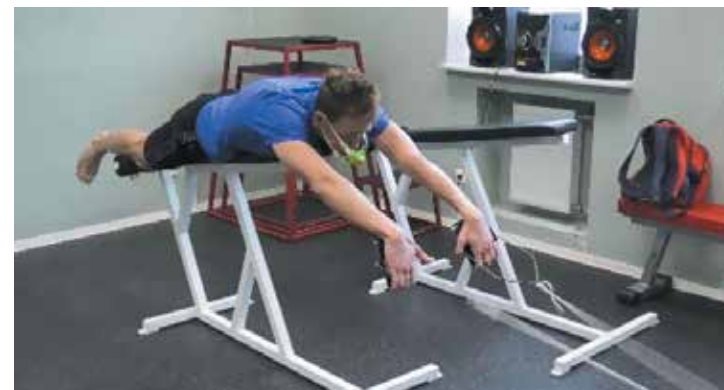
Рисунок 10а. Начальная фаза гребка