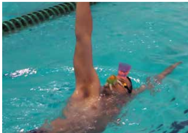
Рисунок 7. Усложнение выполнения упражнений за счет размещения стакана с водой на лбу пловца-спиниста