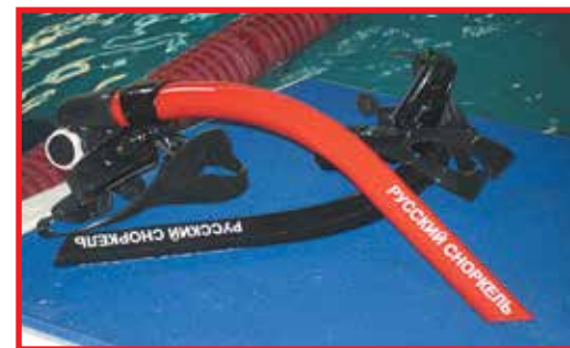
Рисунок 3. Универсальная дыхательная труба для плавания «Русский snorkель – Новое дыхание»

В различных областях деятельности человека раз в 5–6 лет появляется изделие, которое является революционным для этой области. На сегодняшний день в мире существует только одна фронтальная дыхательная трубка для плавания, которая позволяет делать выдох в воду при любом стиле плавания, кроме плавания на спине. Это российская разработка, запатентованная в России и США, выпускается под брендом «Русский snorkель – Новое дыхание».