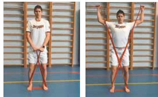
11. Обратное сведение-разведение рук стоя (фото 11)