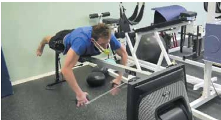
Рисунок 9а. Использование ТДМТ «Русский флаттер – Новое дыхание» на тренажерах изокинетического типа (начальная фаза)