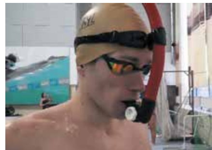
Пример упражнений, выполняемых с УДТП «Русский snorkель – Новое дыхание»

В процессе закупывания после старта данный объем составляет 800–1000 м.