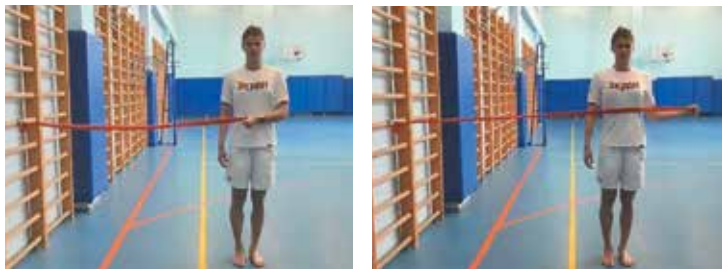
1. Вращение рук наружу стоя (фото 1)