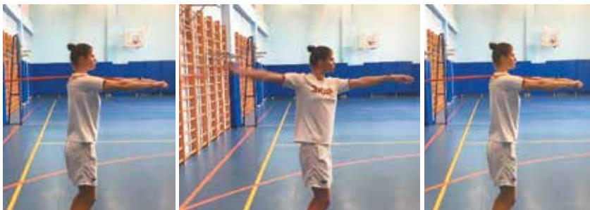
9. Попеременное круговое вращение стоя (фото 9)

После выполнения силового упражнения без отдыха проплыть в координации задание «на гребки» в объеме 2–3 мин (3 x 50 м Р23–24, инт. 15–20 с., 25 м!!! + 25 м «закупка») на пульсе 23–24 уд./10 с. Общее время тренировочного задания 2–3 мин. Отдых 1 мин.