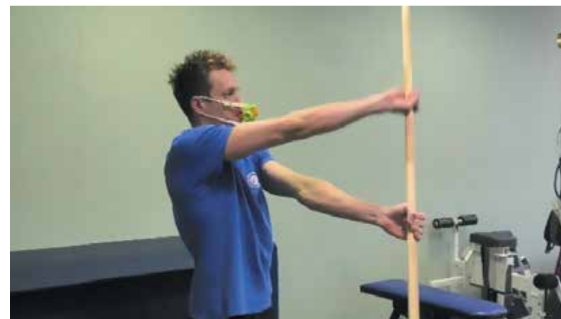
Рисунки 8а, 8б. Упражнения для повышения подвижности в плечевых суставах