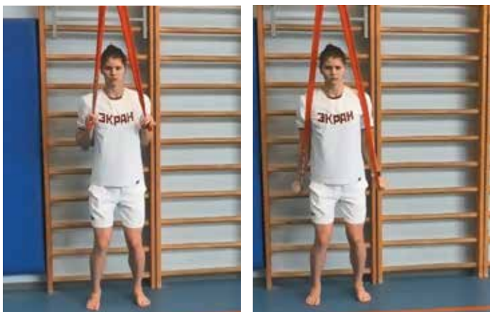
6. Одновременное разгибание рук стоя (фото 6)

После выполнения силового упражнения без отдыха проплыть в координации задание «на гребки» в объеме 2–3 мин. (3 x 50 м. P23–24, инт. 15–20 с., 25 м!!! + 25 м «закупка») на пульсе 23–24 уд./10 с. Общее время тренировочного задания 2–3 мин. Отдых 1 мин.