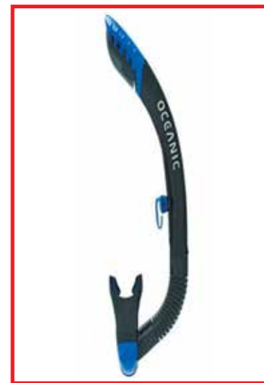
Рисунок 1. Дыхательная трубка для снорклинга

В спортивную дисциплину «скоростное плавание в ластах (в моноласте)» входит плавание в ластах по поверхности воды на время на дистанциях 50–1500 м с ДТ. Скорость плавания более 2,5 м/с, что выдвигает дополнительные требования к ДТ [20].