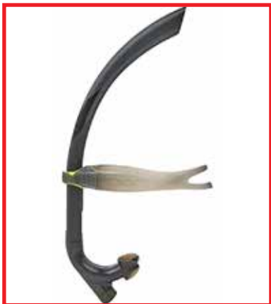
Рисунок 2. Фронтальная дыхательная труба для скоростного плавания в ластах

в ластах имеет фронтальное крепление. То есть труба находится перед лицом, между глаз. Других конструктивных отличий от ДТ для snorkлинга не имеется.