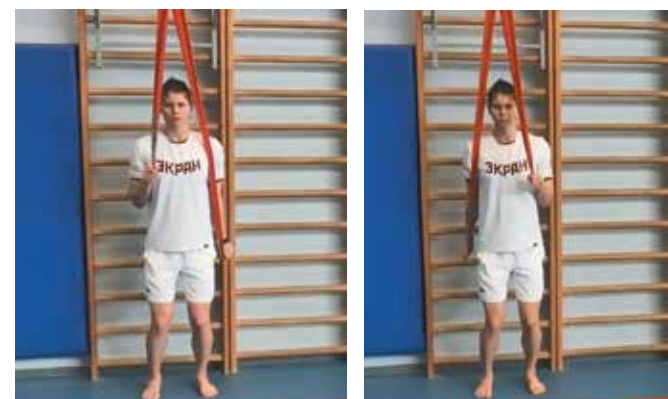
4. Попеременное разгибание рук стоя (фото 4)