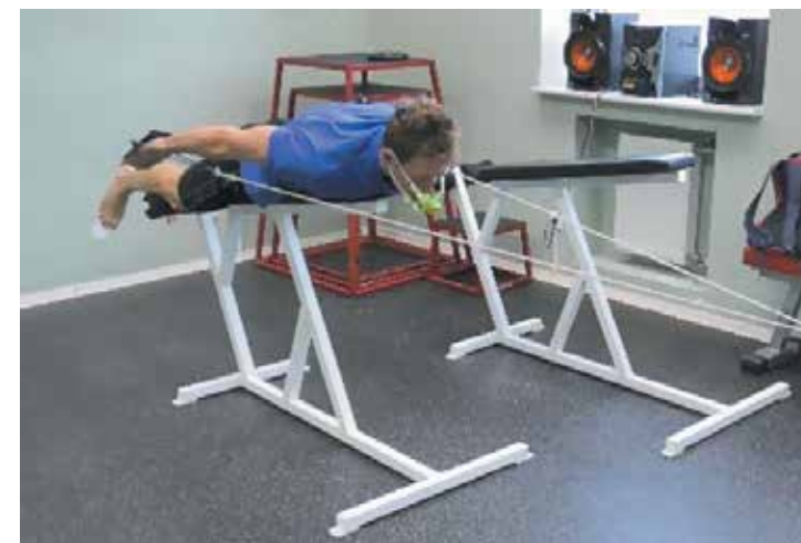
Рисунок 10б. Конечная фаза гребка