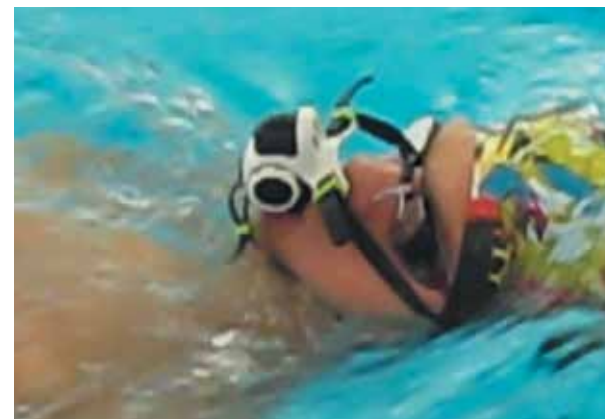
Рисунок 6а. Плавание на спине с ТДМД «Русский флаттер – Новое дыхание» (крупный план)