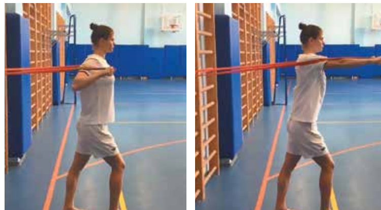
7. Жим от груди в статическом положении (фото 7)