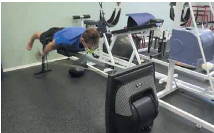
Рисунок 9б. Использование ТДМТ «Русский флаттер – Новое дыхание» на тренажерах изокинетического типа (конечная фаза)