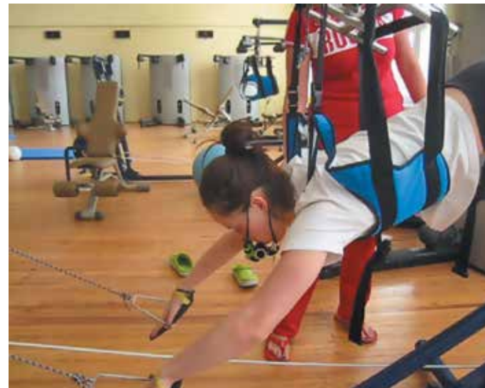
Рисунок 12. Занятия с ТДМД на имитационном тренажере

Пример задания на суше для развития силовой выносливости (2 раза в неделю) с использованием ТДМД «Русский флаттер – Новое дыхание».