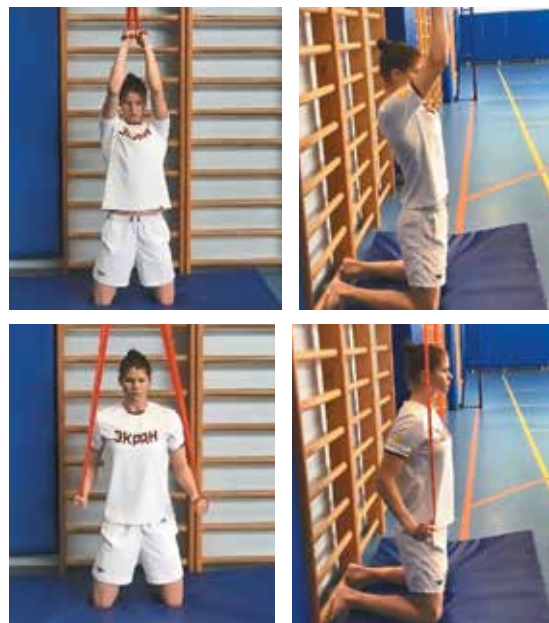
12. Обратная тяга вниз стоя на коленях (фото 12)