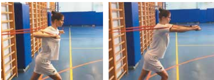
2. Жим над головой в наклоне с одной ногой впереди другой (фото 2)