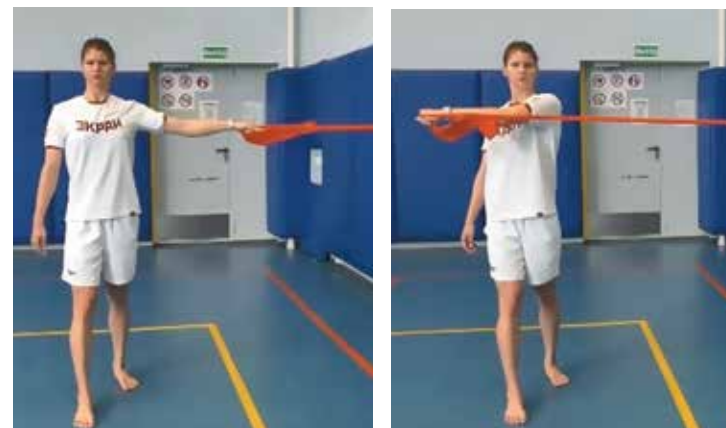
8. Сведение-разведение одной руки с одной ногой впереди другой (фото 8)